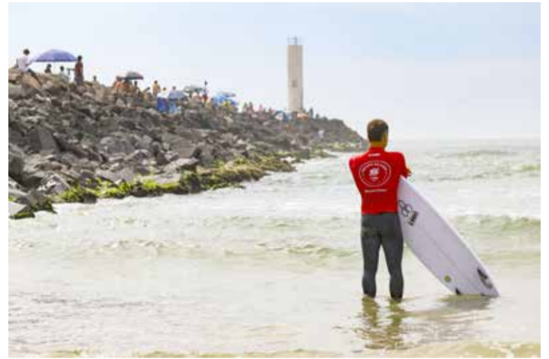
Praia dos Molhes é reduto de campeonatos de surf. Na imagem, etapa de qualificatória para Liga Mundial de Surf, realizada em

para o esporte. “Para o Rio Grande do Sul, é uma honra e uma grande satisfação receber a última etapa do Circuito Taça Brasil, onde serão consagrados os campeões do ano. É uma oportunidade para o povo gaúcho e para os surfistas gaúchos mostrarem nossa força depois de toda a tragédia que enfrentamos, ao mesmo tempo em que acolhemos surfistas de todo o Brasil. Estamos trabalhando para entregar o melhor evento possível e receber a todos da melhor forma”, afirma Cunha.