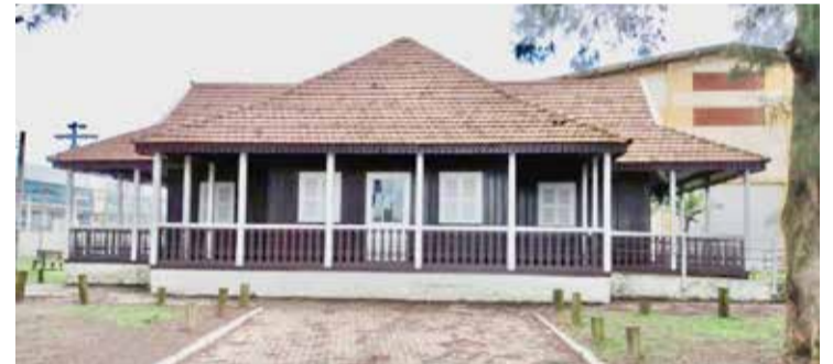
Chalé do Memorial do Surfe, em frente ao calçadão da Praia dos Molhes

Outro local de visitação na área da competição, é o Chalé do Memorial do Surfe, espaço localizado na praça Zeca Scheffer (em frente a SAPT). O Memorial conta com um acervo que conta um pouco da história do surfe gaúcho e materiais didáticos de projetos ambientais.