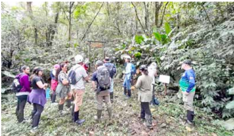
Visita ao Geossítio Portal do Palmiro / Paleotoca Toca do Tatu em Timbé do Sul (SC)