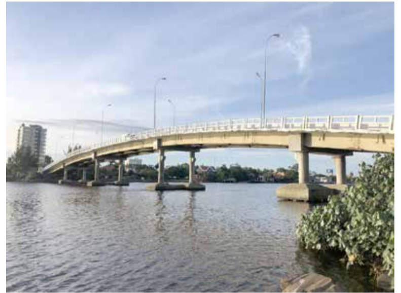
Ponte de concreto que cruza o Rio Mampituba

terá prosseguimento no dia 23 de janeiro, quando será então tratado sobre a reali-