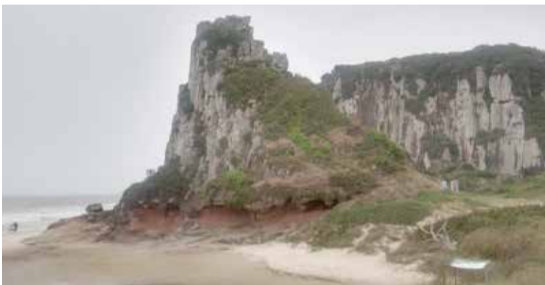
Praia da Guarita é, historicamente, um local com grande número de salvamentos no mar

também para que os profissionais do Corpo de Bombeiros pudessem utilizá-lo como uma guarita permanente de guarda-vidas e ponto de logística para outros pontos da praia, o que ainda não foi implementado pelas autoridades do executivo municipal.