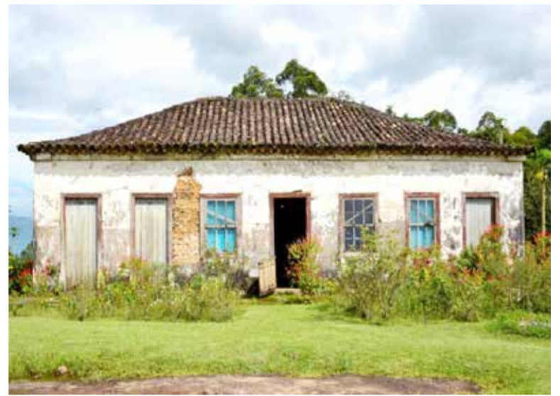
Histórico Casarão dos Müller (Por Efreu Quintana, em Rede Cultura Torres)

não ter havido consulta ao setor antes da confecção da matéria e por não representar a vontade da sociedade deste setor (conforme os ativistas) - acabou recebendo mais emendas ainda, após as mais de 15 anexadas ao projeto de lei pelo vereador Moisés Trisch (PT).