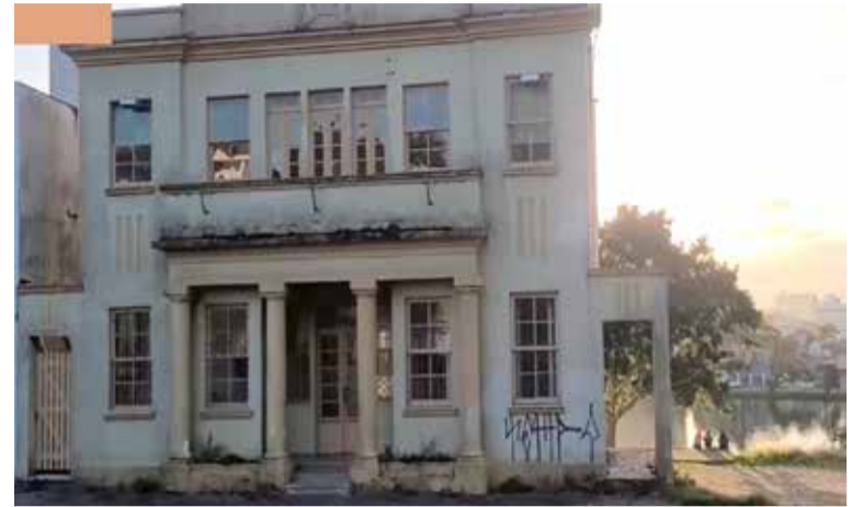
FOTO DE ARQUIVO: Museu Histórico de Torres (Antiga Prefeitura) está há anos sem abrir as portas

Em maio de 2024, uma comitiva do Centro de Estudos Históricos de Torres e Região (CEHTR), membros do Conselho Municipal do Patrimônio Histórico Artístico e Cultural (COMPHAC – Torres) e representantes da Secretaria de Cultura de Torres estiveram realizando uma vistoria as dependências do Museu Histórico do muni-