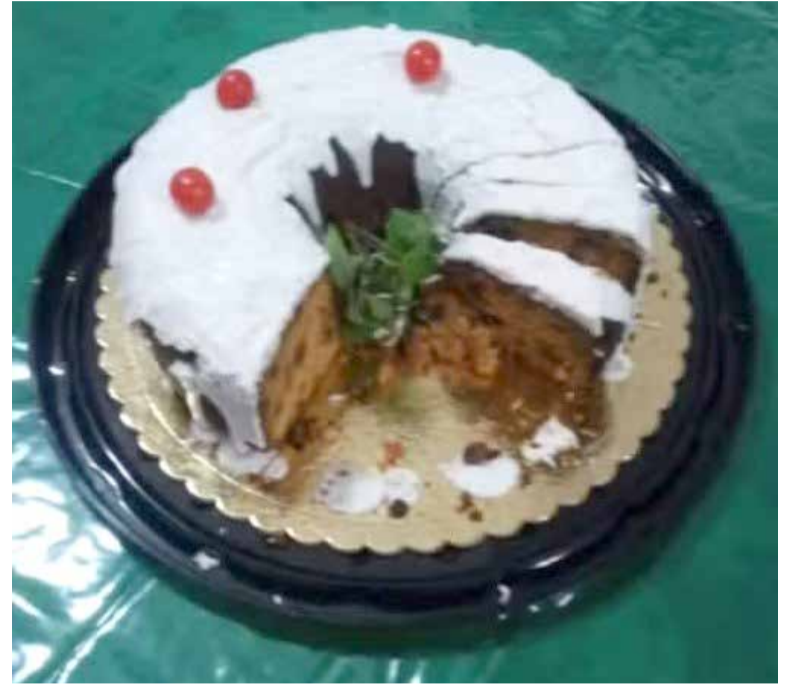
Bolo que teria causado envenenamento