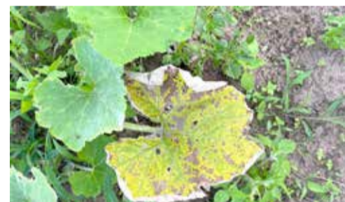
Folha de moranga, cuja plantação teria sido atingida pela deriva de agrotóxicos

https://www.agricultura.rs.gov.br/canais-para-denuncia-de-deriva-do-2-4-d - orienta como agricultores e agricultoras podem denunciar problemas com herbicidas hormonais. para o e-mail denunciashormonais@agricultura.rs.gov.br ou para o WhatsApp, (51) 98412-9961.