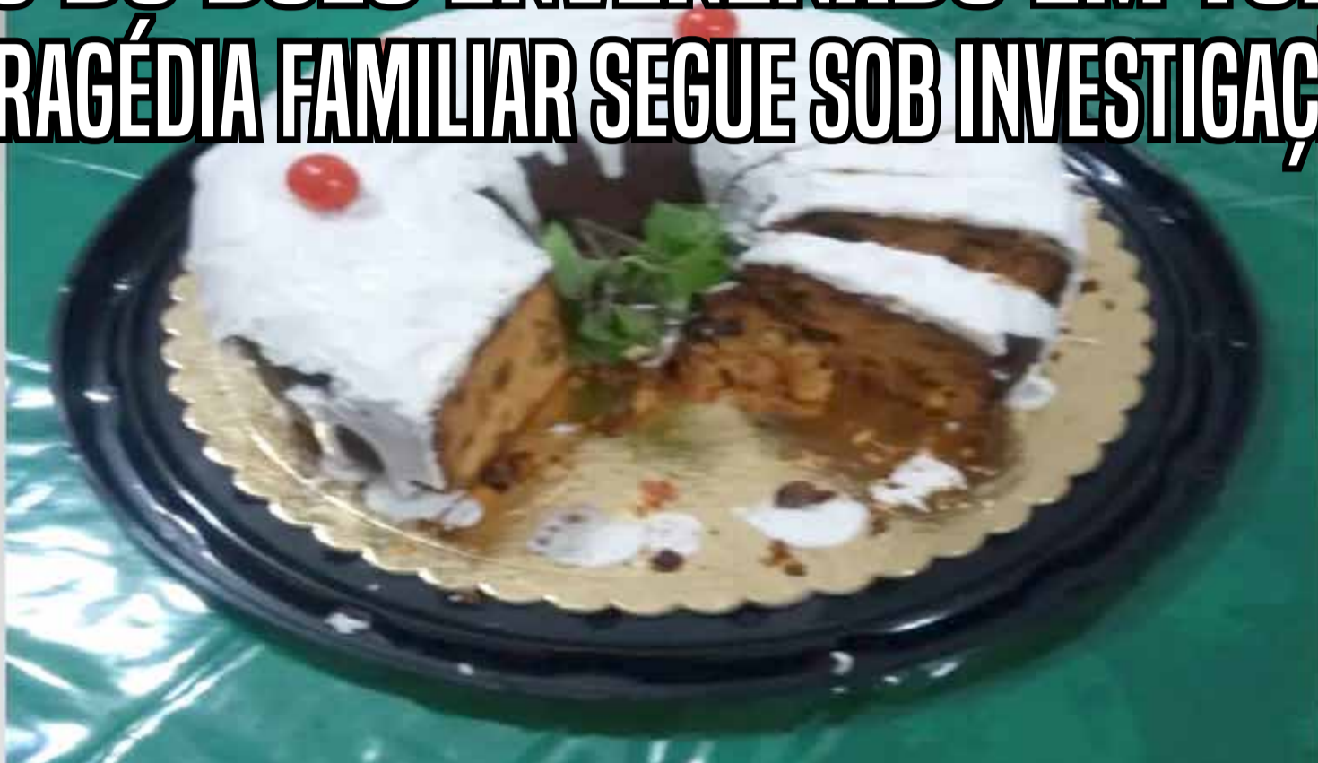
Três pessoas de uma mesma família morreram após consumir bolo com veneno arsênio (foto) em confraternização familiar no dia 23 de dezembro. Nora da mulher que fez o bolo foi presa como suspeita (sendo que ela também está sendo investigada pelo morte do sogro).