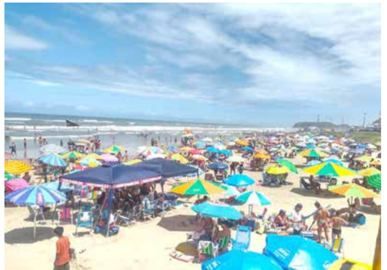
Praia Grande, em Torres

pontos de água salgada monitorados. As coletas de amostras na região são feitas semanalmente pela Gerência Regional do Litoral Norte Sema-Fepam (Gerlit), que envia o material para análise microbiológica pela Divisão de Laboratórios (Dilab), em Porto Alegre. O próximo resultado deverá ser divulgado na tarde desta sexta (10).