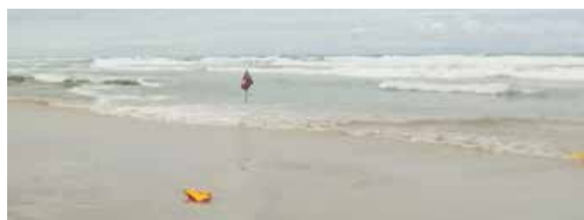
Área de risco demarcada na Prainha, Torres

Conforme o CBMRS, guarda-vidas da guarita 8 (distante cerca de 350m do local) realizaram moto aquática para o resgate. A vítima feminina foi retirada rapidamente da água pelos guarda-vidas e não precisou de atendimento hospitalar. Já o jovem foi retirado da água após ficar submerso por um longo período. Seguido ao resgate, ele precisou de manobras de reanimação na areia (mas-