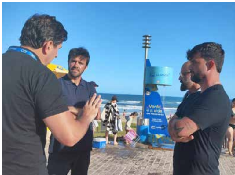
Novo secretário do Meio Ambiente e coordenador de Vigilância Sanitária de Torres em conversa com representante da Corsan sobre assunto

ção das redes de esgoto, utilização de geradores nas casas de bomba e análises biológicas semanais da qualidade das águas. Ainda destacou que tem intensificado as ações de fiscalizações das ligações clandestinas e o lançamento de gordura na rede de esgoto.