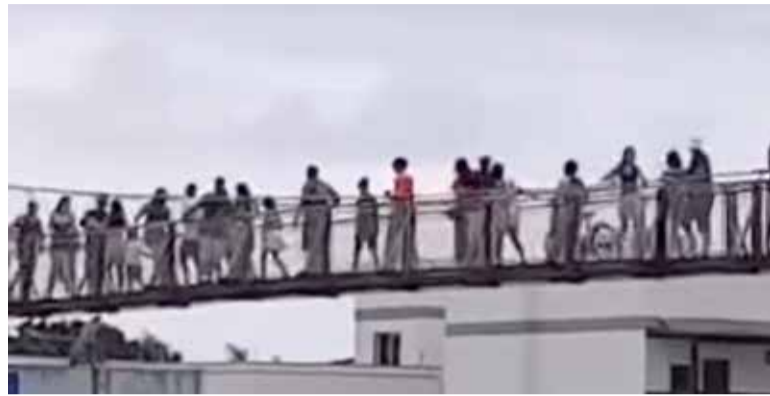
imagem da ponte superlotada em 30 de dezembro

morte e deixou dezenas de feridos. A estrutura foi reinaugurada em junho deste ano e teve a capacidade de travessia reduzida. Porém, mesmo com a recuperação da estrutura, o Gabinete de Assessoramento Técnico (GAT) do MP emitiu parecer pela limitação do tráfego de pessoas – que foi reduzido de 20 para 10 pessoas ao mesmo tempo. Além de limitar o fluxo, também instituiu a interdição parcial no Natal, Ano Novo, Carnaval e festa de Nossa Senhora dos Navegantes (datas festivas de grande movimento).