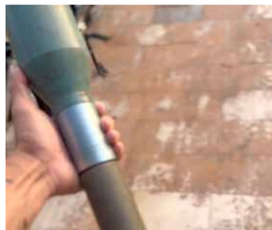
O Artefato explosivo encontrado dentro de residência (Foto: Arquivo Pessoal/ via Rádio Tupancy)

Apesar do alívio com o desfecho da operação, o caso levanta questionamentos sobre os cuidados necessários no manejo de objetos históricos com potencial risco, bem como a importância de acionar as autoridades imediatamente em situações semelhantes. (FONTE: Alexandre Ribeiro/Rádio Tupancy)