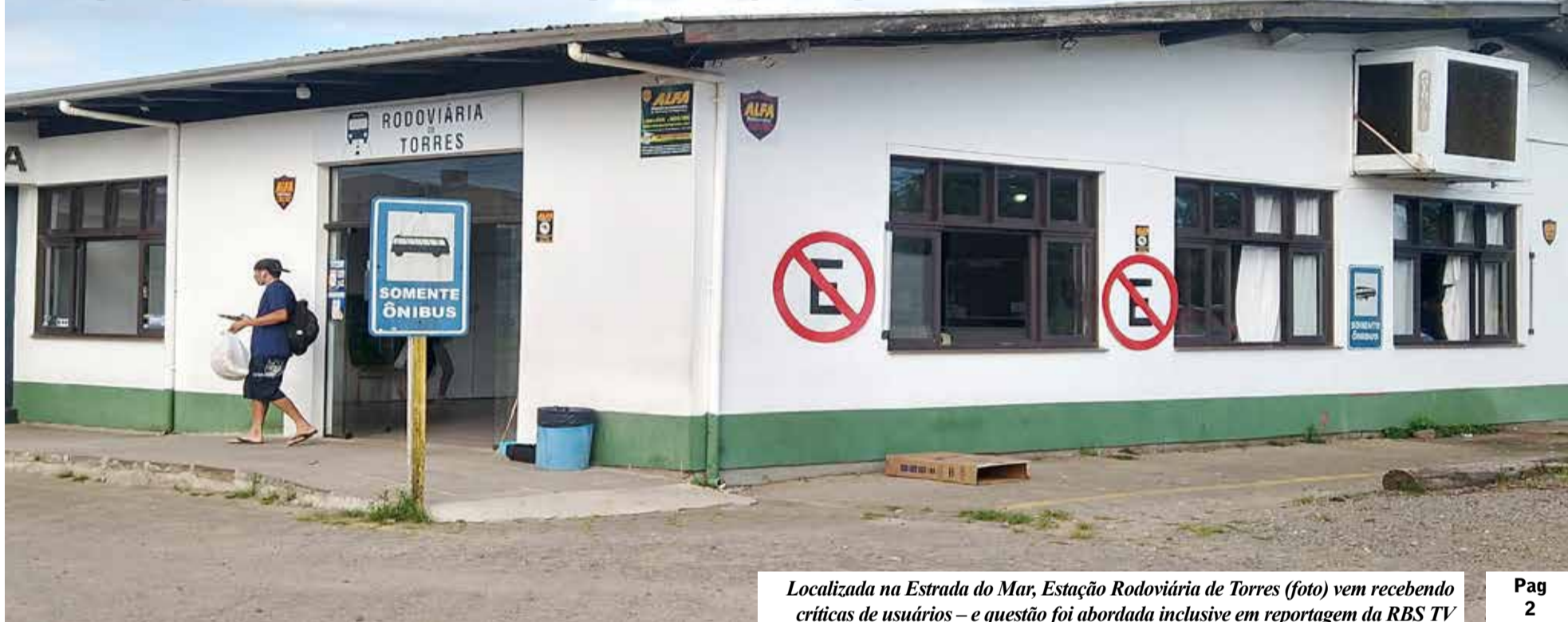
Localizada na Estrada do Mar, Estação Rodoviária de Torres (foto) vem recebendo críticas de usuários – e questão foi abordada inclusive em reportagem da RBS TV