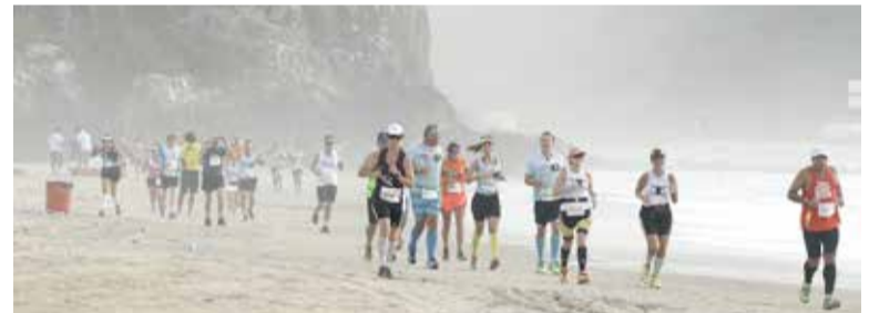
Saída da TTT em Torres, no ano de 2016

atletas, o evento se destaca como um dos maiores do gênero no Brasil. O evento contará com diversas largadas com quatro baterias ao longo do dia, distribuídas da seguinte forma: 06:00 – UITTTRA/ 06:30 – Duplas/ 07:00 – Quartetos/ 07:30 – Octetos/ 08:00 – MaraTTThon/ 08:30 – Desafio do Último Trecho (8,3 km)