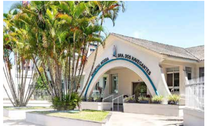
FOTO DE ARQUIVO - Fachada do Hospital de Torres