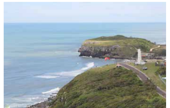
Morro do Farol e Morro das Furnas