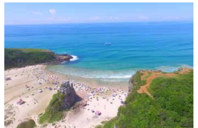
Praia da Guarita – com torre Sentinela ao centro