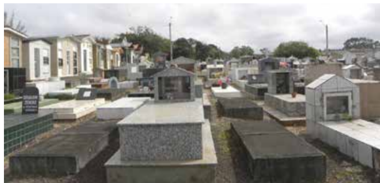
Cemitério Municipal do Campo Bonito

Gimi sinaliza que preparação da sepultura estaria custando R$ 2.400 e a taxa simples R$ 1.400