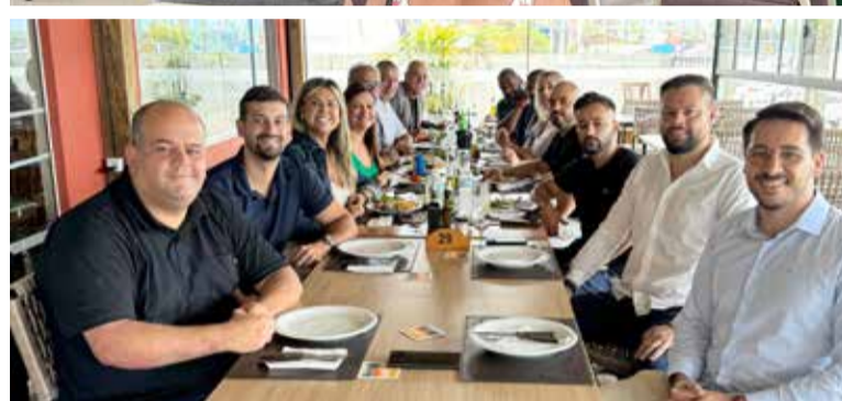
Almoço com políticos (com e sem mandato) de Torres e região