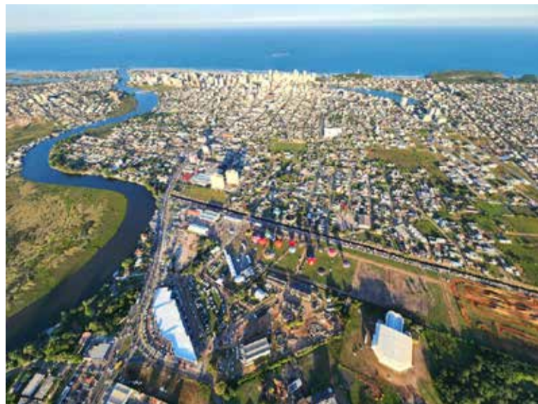
Vista Aérea de Torres

As cinco praias com maior volume de transações imobiliárias em 2024 foram: