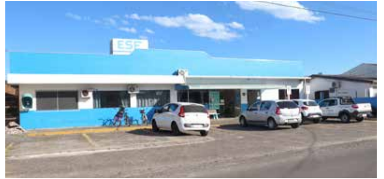
ESF em Arroio do Sal

A vacinação foi suspensa na unidade Centro desde que as obras iniciaram. Mas a população de Arroio do Sal continua contando com a sala de vacinação nos balneários Figueirinha e Rondinha.