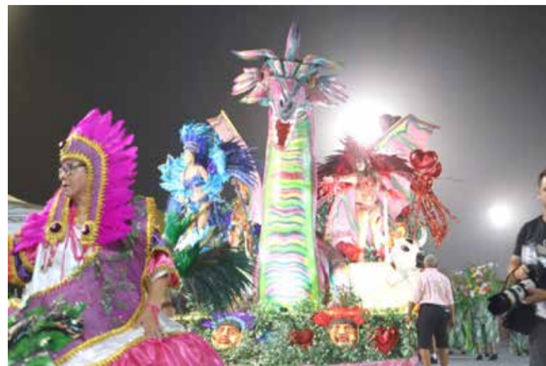
Desfile do Carnaval de Arroio do Sal 2024

Confira a ordem e horários exatos dos eventos: