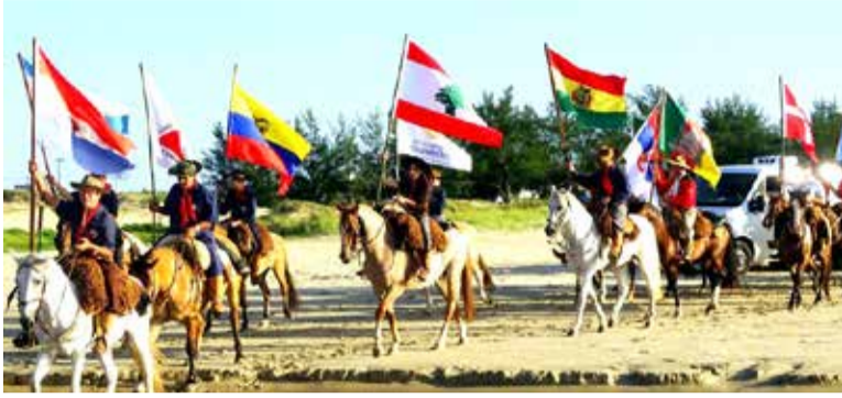
Edição da Cavalgada do Mar de 2016

A 39ª edição da tradicional Cavalgada do Mar terá início neste sábado (22 de fevereiro) e se estenderá até o dia 28 de fevereiro deste ano. O evento, que celebra a cultura gaúcha e o amor pela cavalgada, percorrerá o trajeto desde Cidreira (saída no parque do Farol) especialmente pela orla, tendo Torres como ponto culminante. No trajeto, cidades como Tramandaí, Imbé e Capão da Canoa irão promover eventos para recepcionar os