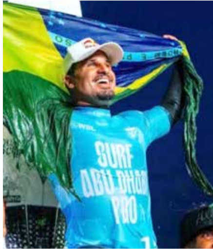
Parabéns! Ítalo Ferreira campeão da etapa do mundial de surf em Abu Dhabi