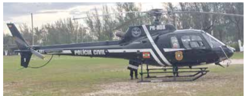
Helicóptero chegou a ser acionado para resgate do jovem