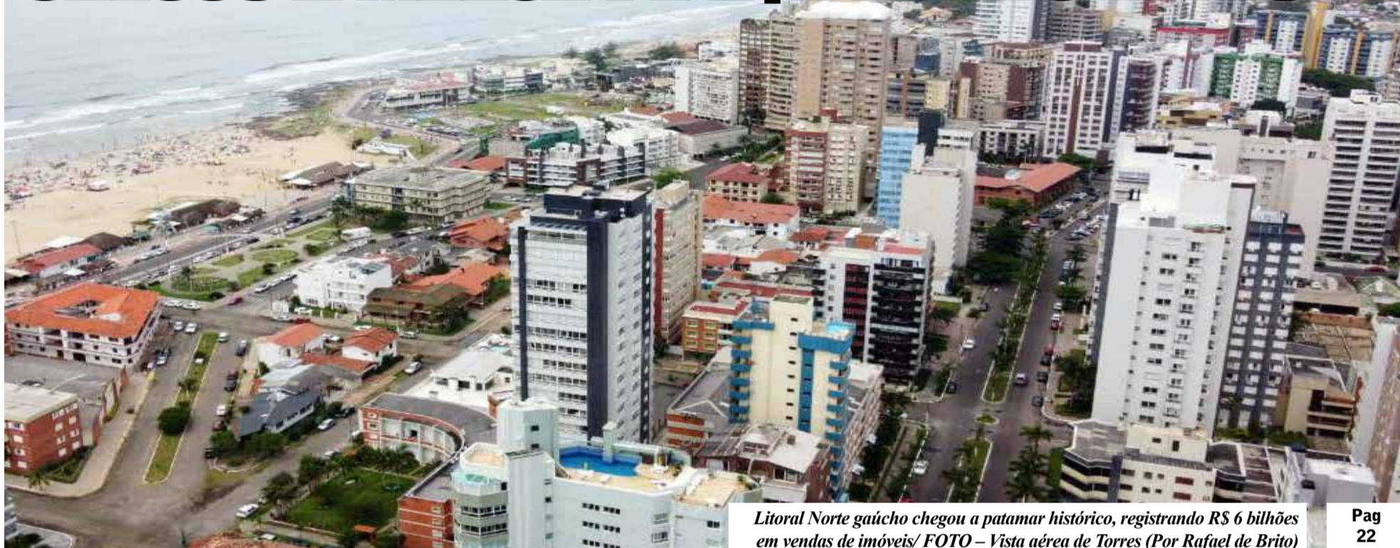
Litoral Norte gaúcho chegou a patamar histórico, registrando R$ 6 bilhões em vendas de imóveis/ FOTO – Vista aérea de Torres