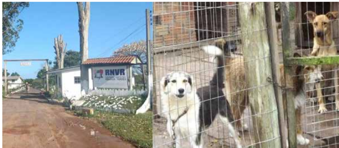
Local de tratamento para dependentes químicos e Canil – informações sobre os terrenos são demandadas na indagação da Câmara

Na justificativa os autores (Mesa Diretora da Câmara) defende que o pedido formal visa atender a necessidade de transparência na gestão do patrimônio público de Torres, além da importância de definir o destino das áreas, que