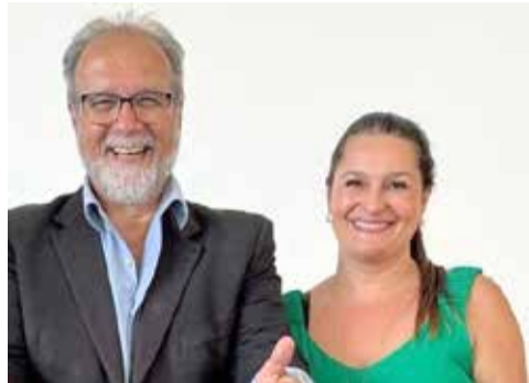
Silvana trouxe Victorino para debater em Torres

Victorino, que é presidente da Comissão de Economia, Desenvolvimento Sustentável e do Turismo na Assembleia Legislativa destacou a alta carga tributária do Rio Grande do Sul, uma das mais altas do país: "A situação do Rio Grande do Sul é muito grave, o governador está contando com o aumento de impostos sobre a gasolina, mas alguns dos recursos federais - que foram antecipados pelo governo federal por conta das enchentes - não estarão presentes em 2025 e, isso vai impactar ainda mais no nosso orçamento", disse Victorino, ao salientar que o orçamento aprovado ano passado já apresentava um déficit de R$ 3,2 bilhões.