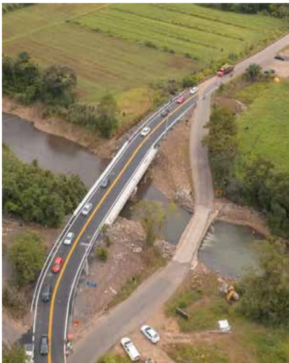
Nova ponte

Entregue pelo governo do RS, a via é usada para o deslocamento dos moradores, transporte escolar e escoamento da produção local. Antes possuía apenas uma pista, e agora são duas