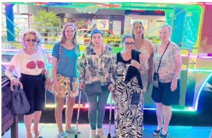
As tradicionais Amigas da Praia de Torres foram na Carreta da Alegria