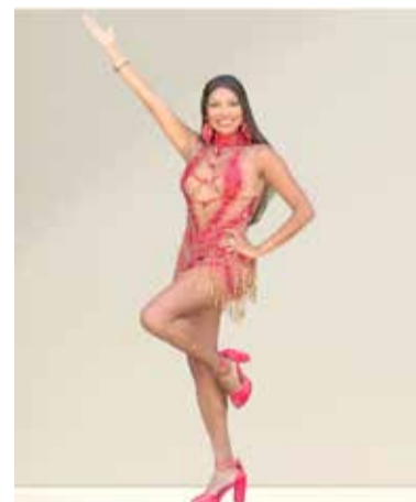
teu no concurso Rainha do Carnaval de Porto Alegre, vindo a integrar a corte da nossa capital, no início dos anos 2000.

"Minha história com o carnaval teve início na infância, quando acompanhava minha mãe nos ensaios de escolas de samba em Porto Alegre. Aos 16 anos, fui convidada para ser rainha da Tribo Os Guaianazes, a qual represen-