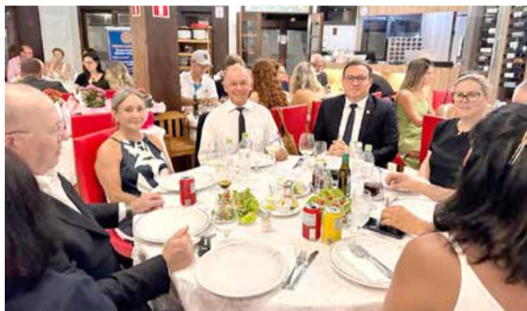
Mesa com diretores e sócios ilustres do Rotary Torres

120 anos de fundação no mundo; 28 anos do clube em Torres