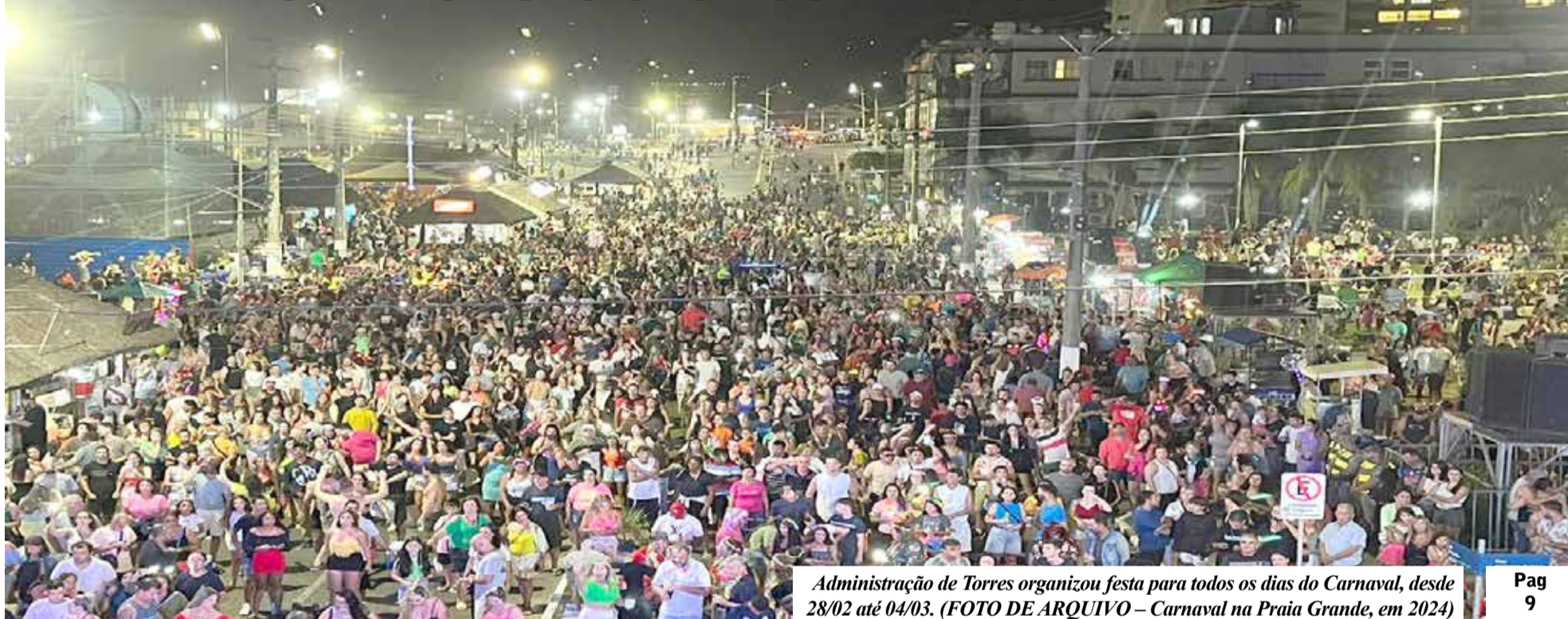
Administração de Torres organizou festa para todos os dias do Carnaval, desde 28/02 até 04/03. (FOTO DE ARQUIVO – Carnaval na Praia Grande, em 2024)