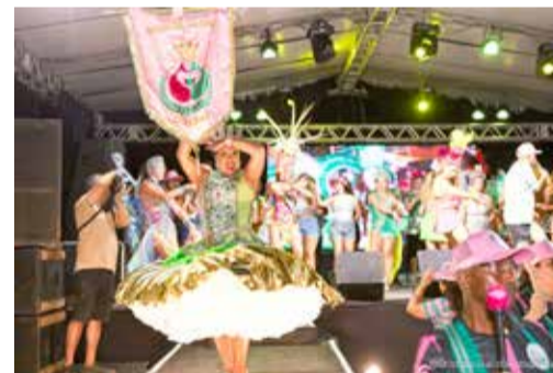
00:50 – Gigantes da Orla

Desfile competitivo oficial 21h30min – Abertura Oficial e apresentação da Corte do Carnaval 2025 21:50 – Bloco Turma do Funil 22:30 – Escola Camas 23:40 – Saímos Sem Querê