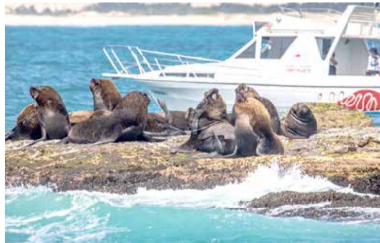
Turismo embarcado próximo a Ilha dos Lobos consta no Plano de Uso

Os próximos passos são a construção do Protocolo de Gestão da