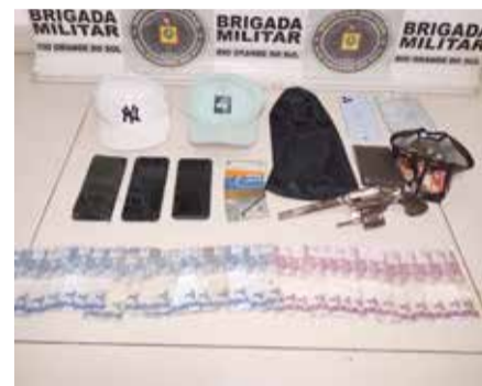
lista Jussara Pelissoli/CRPO Litoral