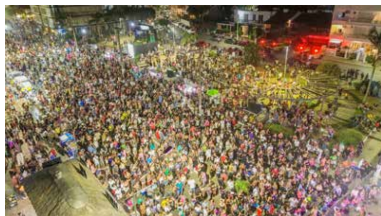
Beira-Mar da Praia Grande foi ponto principal do encontro dos foliões