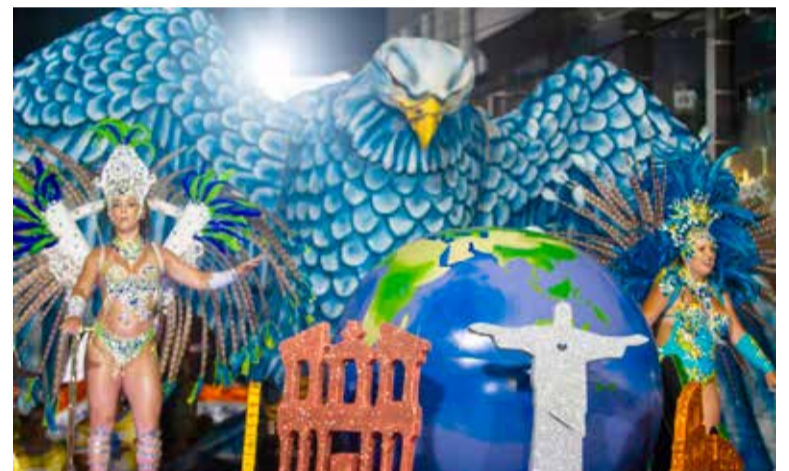
Carro alegórico da Saímos Sem Querê

Redentor, Machu Picchu, Petra, Coliseu romano, Taj Mahal, Chichén Itzá e a Muralha da China foi grandiosa à altura das maravilhas.