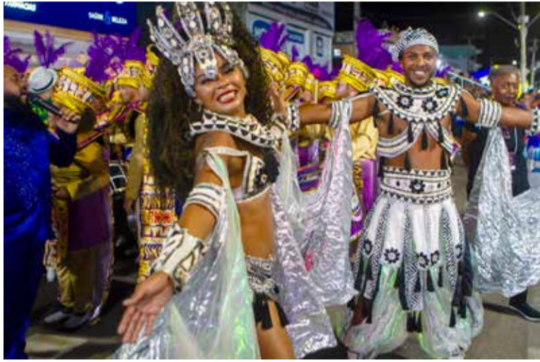
Camas homenageou lemanjá