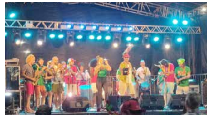
Excelente a apresentação da Banda Jucurutu