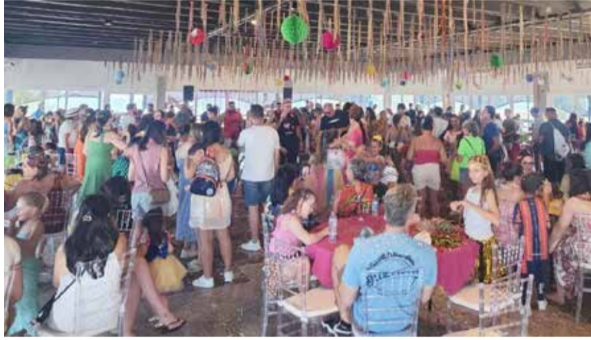
Mais de mil pessoas no Carnaval Infantil da SAPT