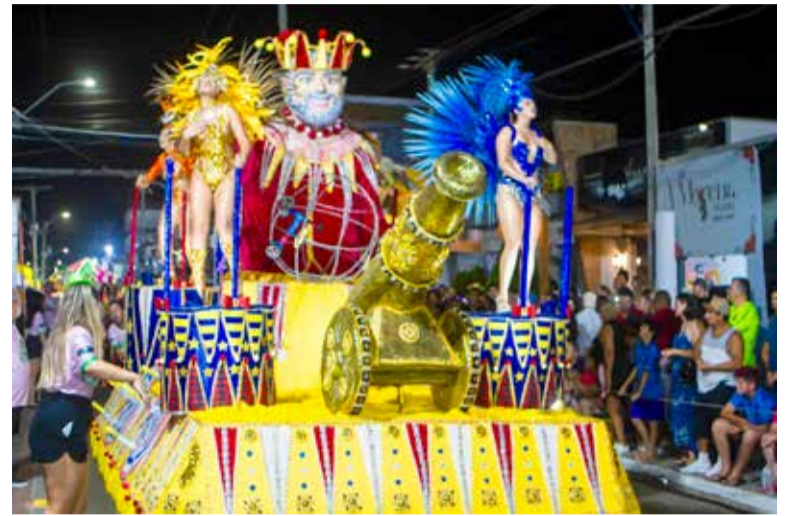
Carro alegórico da Gigantes da Orla

Seguindo a ordem de sorteio, este ano o espetáculo competitivo começou com o Camas. Após 5 anos desfilando como bloco, a escola retornou para a competição como o enredo "Yeyé Omo Ejá", homenageando lemanjá. Com três alegorias e alas belas e animadas, Camas resgatou as raízes na cultura africana.