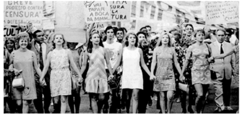
Na foto, protesto de mulheres em São Paulo, durante ditadura cívico-militar. Na linha de frente as atrizes Eva Todor, Tônia Carrero, Eva Wilma, Leila Diniz, Odete Lara e Norma Bengell.

*Com Wikipedia, BBC Brasil e Mundo Educação