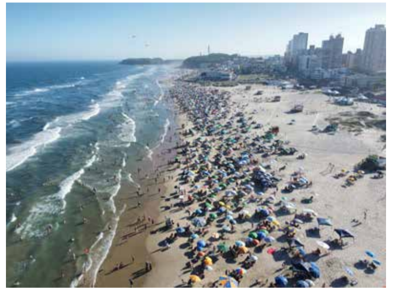
Argentinos foram os que mais vieram para o RS em janeiro, sendo Torres um dos destinos favoritos destes

A Argentina se destacou como o principal país emissor de turistas para o Brasil. O número de visitantes do país vizinho praticamente dobrou em relação a janeiro de 2024. No primeiro mês do ano passado, 452.136 argentinos visitaram o Brasil, enquanto, em 2025, esse número saltou para 870.318.