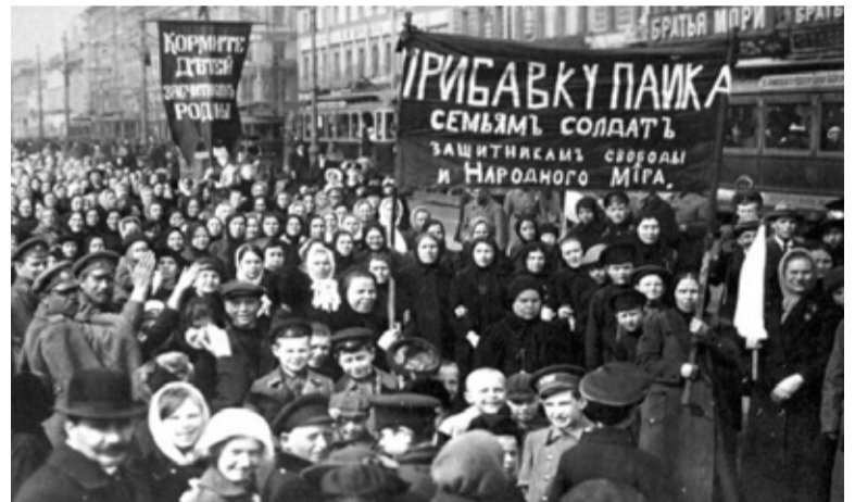
Greve das operárias foi estopim da revolução russa de 1917