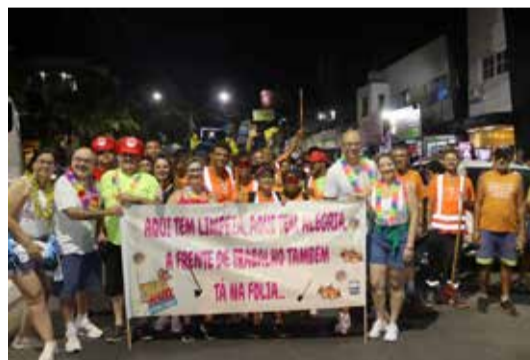
Bloco da Secretaria Municipal de Obras limpou tudo no final da festa