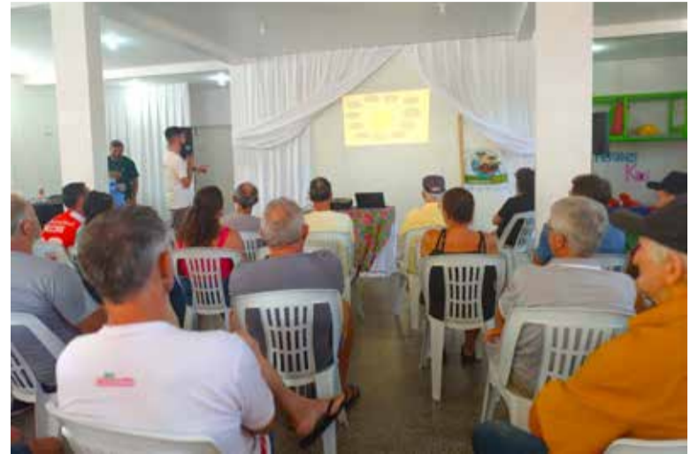
Núcleo da Rede Ecovida

O tema das derivas será novamente abordado na primeira plenária de 2025 do núcleo, no dia 11 de março.