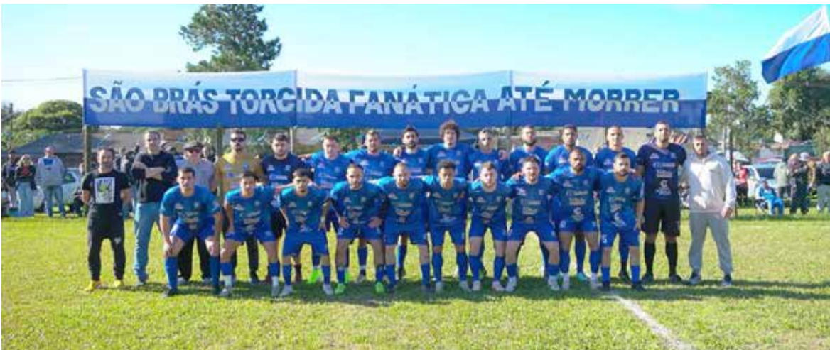
Plantel do São Brás

Assim, o São Jorge superou o São Luiz por 2 a 1 e leva vantagem para o confronto decisivo. A decisão final está marcada para o dia 31 de agosto, no campo do São Jorge.