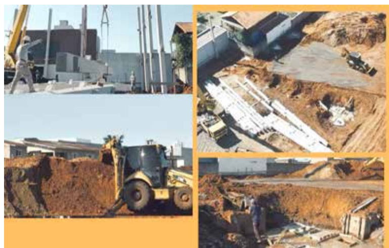
Obras da Escola já estão em curso, junto ao Morada das Palmeiras

A Escola Impulso Torres deverá ser aberta no ano de 2026, conforme afirmou a diretora e empreendedora do sistema de ensino.