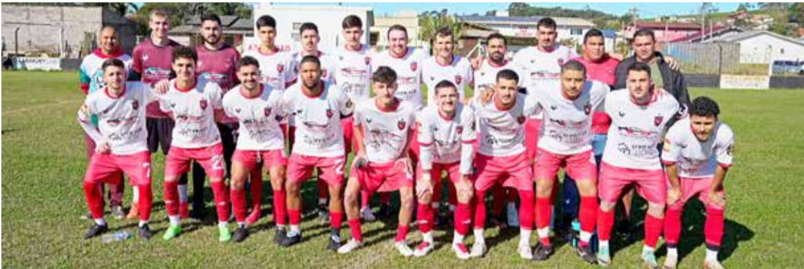
Plantel do São Luiz