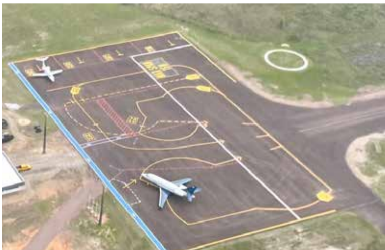
Aeroporto de Torres, em outubro de 2024

Após investimentos, busca por mais utilidade no Aeroporto de Torres