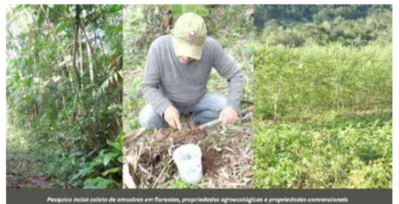
Pesquisa inclui coleta de amostras em florestas, propriedades agroecológicas e propriedades convencionais

Conforme o agrônomo, apesar do solo da floresta ser o parâmetro para esta pesquisa, o estudo não é comparativo. "É pra gente ter esta percepção e essa avaliação dos manejos e uso destes solos, e depois relacionar as ca-