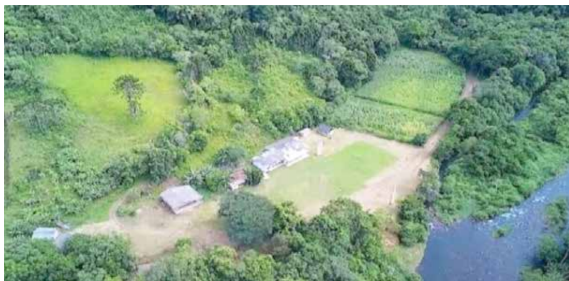
Comunidade Quilombola em Praia Grande SC