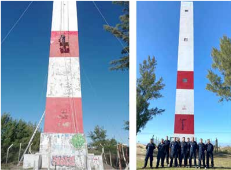
O antes (e) e o depois (d) do Farol de Arroio do Sal, após manutenção

Um dos principais símbolos e pontos turísticos de Arroio do Sal foi revitalizado nesta última semana. Com a supervisão e apoio da