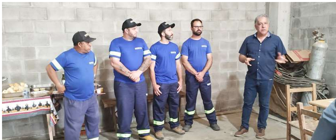
Diretor Jorge apresenta funcionários da Usina para atender a região