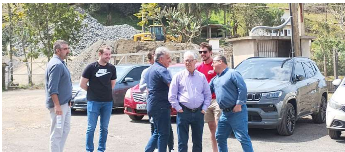
Ao fundo, pedreira Diamante Negro (também de Torres) que fornece a brita, insumo a ser utilizado na massa asfáltica.