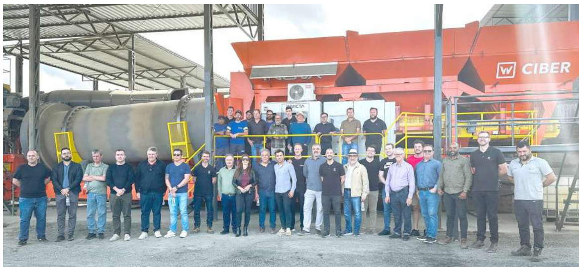
Evento de inauguração - com a presença de ilustres convidados.

O equipamento adquirido, uma usina da marca CIBER - modelo Inova 1200, é reconhecido internacionalmente por sua eficiência tecnológica avançada e grande ca-