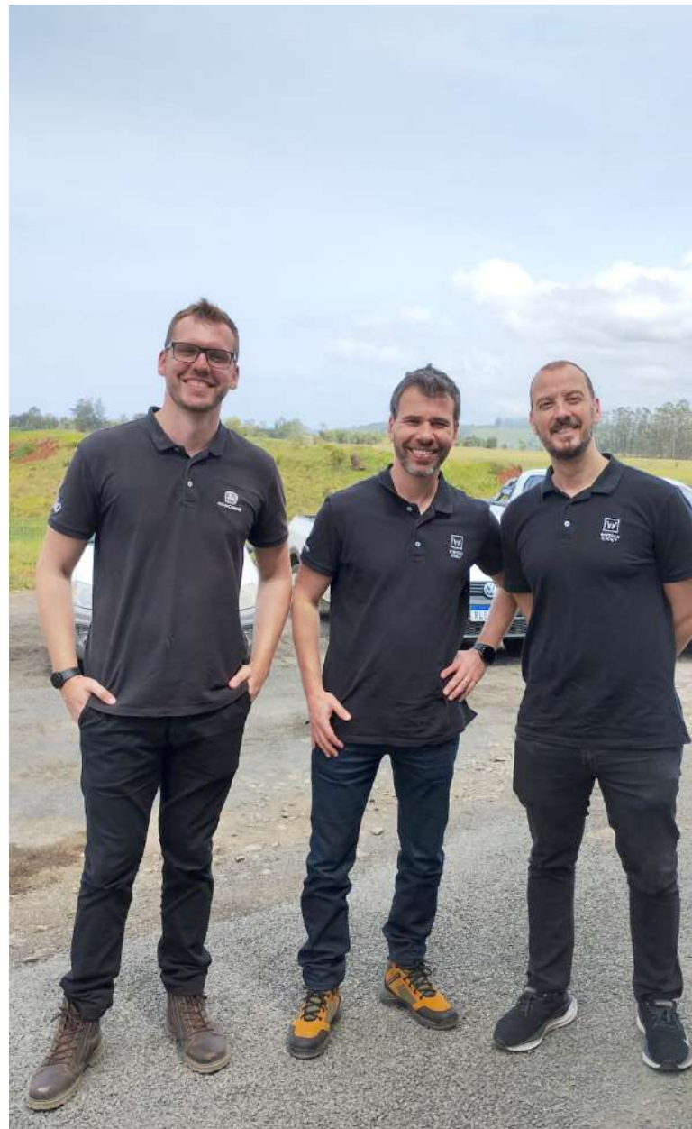
Representantes da fábrica alemã no Brasil, que utiliza matéria prima brasileira para construir suas usinas de última geração.