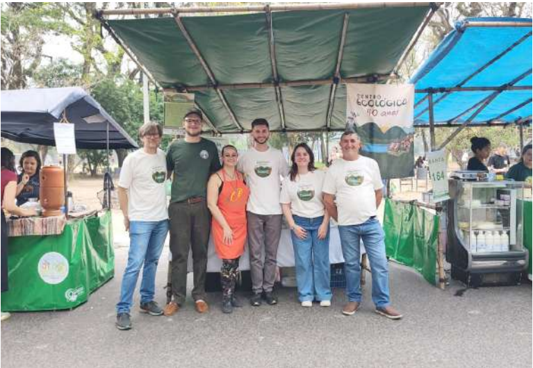
lização justa de alimentos ecológicos. Assim, junto com a Cooperativa Coolmeia, promoveu, em 1989, a feira que hoje se chama FAE.

cia e Aesba. A erva-mate orgânica desta e de outra mateada - já realizada na programação dos 40 anos do Centro Ecológico - é produzida em sistema agroflorestal pela família Zanotto, na Serra do RS. Feiras e Centro Ecológico - Depois de três anos de investigação, com apoio da Rede Terra do Futuro da Suécia, as práticas do projeto desenvolvido na propriedade rural de 70 hectares começaram a ser adotadas por famílias da Serra Gaúcha. Foi a partir da produção destas famílias que o Centro Ecológico passou a trabalhar também para construir canais de comercia-