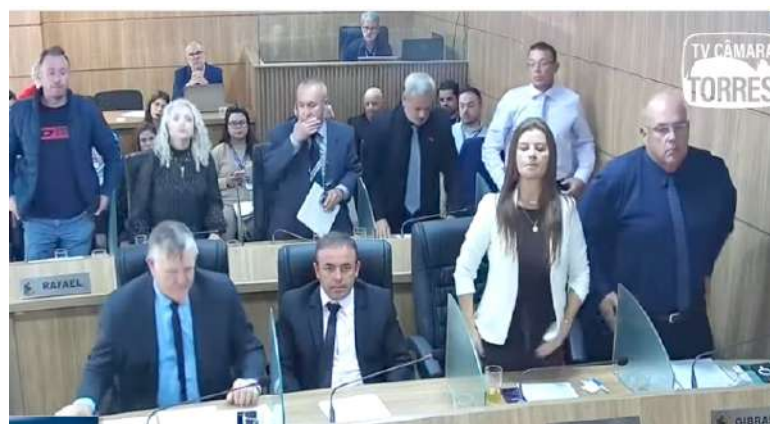
Parte dos vereadores de Torres, durante a votação. Os que estão de pé votaram contra a moção de repúdio. Os sentados, a favor da moção