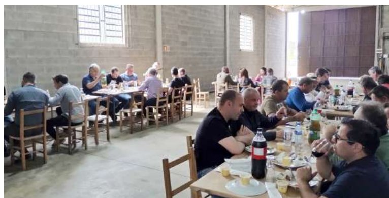
Empresários, prefeitos, secretários municipais, engenheiros e funcionários confraternizaram com um Churrasco de início de operação da usina.

cia, menor impacto ambiental e um padrão de qualidade que atende às exigências mais rigorosas do setor". "A Invicta Engenharia seguirá pavimentando caminhos que conectam desenvolvimento, mobilidade e qualidade de vida para toda nossa região", ressalta o empresário torrense.