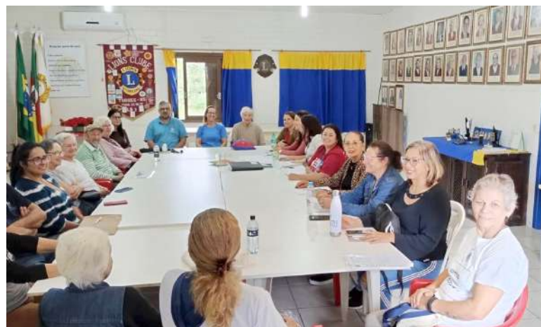
Conselho - formado por agentes públicos, privados e sociedade civil - se reúne mensalmente