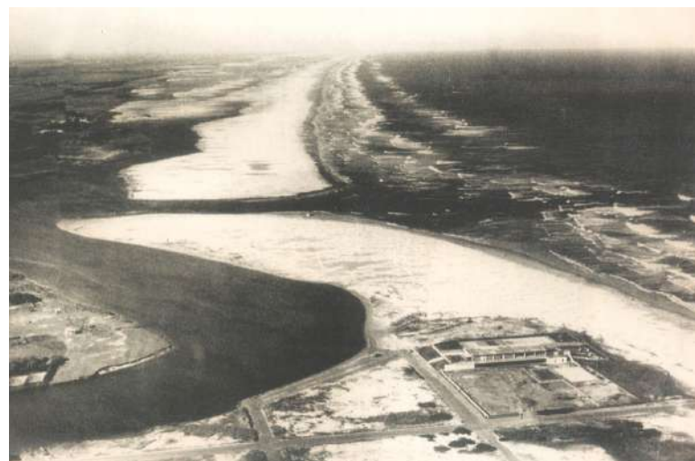
Sede esportiva da SAPT - ainda sozinha e respeitando plano local

O tema do planejamento urbano, inclusive, chegou a ser assunto em boletins in-