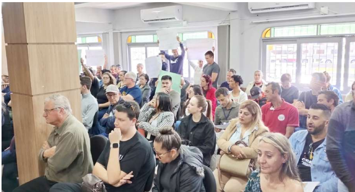
Ambiente na Câmara foi de debates e questionamento, principalmente pela nova localização da Casa de Passagem

As acomodações do Plenário da Câmara Municipal de Torres lotaram, com cidadãos defendendo posicionamentos diferentes: alguns mais favoráveis a aplicação