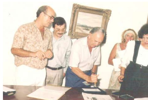
Momentos solenes em nome do clube e principalmente de TORRES

estrutura esportiva no Mampituba (1976–1984). Já na década de 1980, o clube consolidava suas atividades sociais e esportivas, tornando-se ponto de encontro da comunidade nas temporadas de verão.