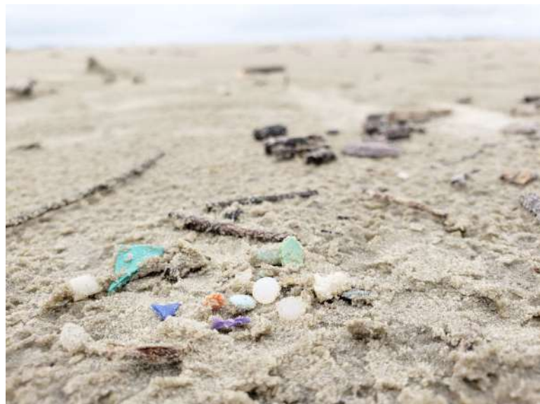
Microplástico na areia em praia do sul do Brasil (foto meramente ilustrativa: via Mateus Farias Mengatto/ UFPR)

O Ministério do Meio Ambiente e Mudança do Clima (MMA) disse acompanhar as pesquisas sobre o tema. Em nota enviada à DW, destacou a importância da Estratégia Nacional Oceano sem Plástico (ENOP), publicada no dia 1º de outubro. "É uma iniciativa inédita do governo federal que orienta e coordena ações estratégicas, sinérgicas e multissetoriais para a prevenção, redução e eliminação da poluição por plástico no oceano até 2030", informou o MMA.