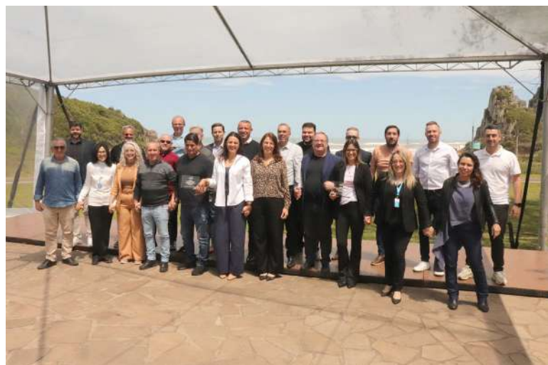
de no atendimento à população Torres

“As destinações orçamentárias reforçam o compromisso com a saúde pública, contribuindo para o fortalecimento da estrutura hospitalar e garantindo mais qualida-