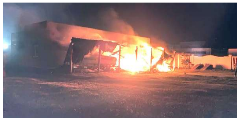
Incêndio na sede da Patram de Capão da Canoa

A busca pelos demais envolvidos seguiu sendo feitas no começo da semana. Câmeras de segurança internas e de ruas próximas ao local estão sendo analisadas para identificar os autores e esclarecer a motivação do ataque. "As diligências estão avançando e acreditamos que mais pessoas participaram