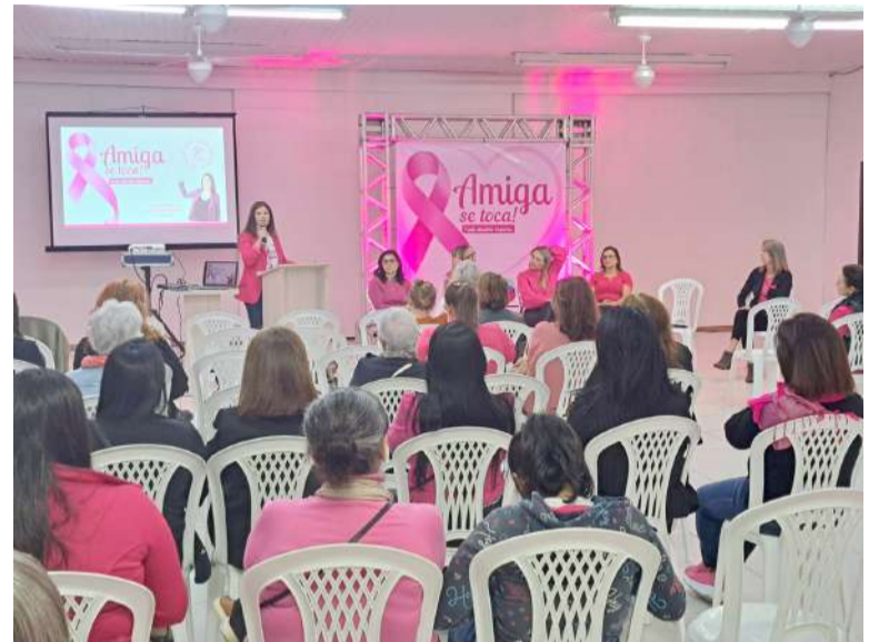
2ª edição do 'Amiga se Toca' realizado ano passado

O Outubro Rosa é uma campanha mundial que tem como foco principal a prevenção e o diagnóstico precoce do câncer de mama e de colo do útero, reforçando a necessidade de consultas regulares, exames preventivos e atenção à saúde da mulher em todas as fases da vida. (FONTE – Gabinete Ver. Carla Daitx)