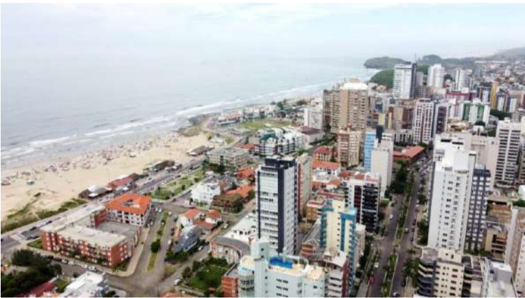
Vista aérea parcial de Torres, próximo à beira-mar da Praia Grande