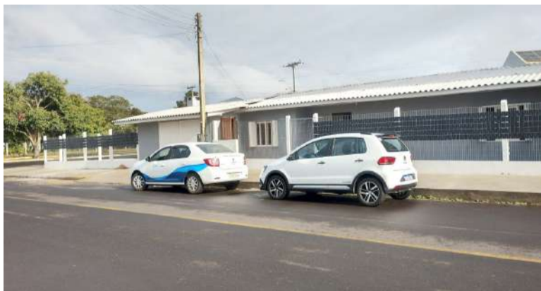
Casa de Passagem - localizada quase na esquina da Av. do Riacho (foto), perto da APAE. Ideia era de que serviço deveria trocar de lugar em breve

ser próximo de escolas, da APAE e de Creches da cidade. Já o vereador Gimi Vidal (PP) denunciou outras supostas irregularidades do espaço licitado - que não estaria de acordo com as necessidades especificadas no edital - além do valor (cerca de R$ 65 mil mensais).