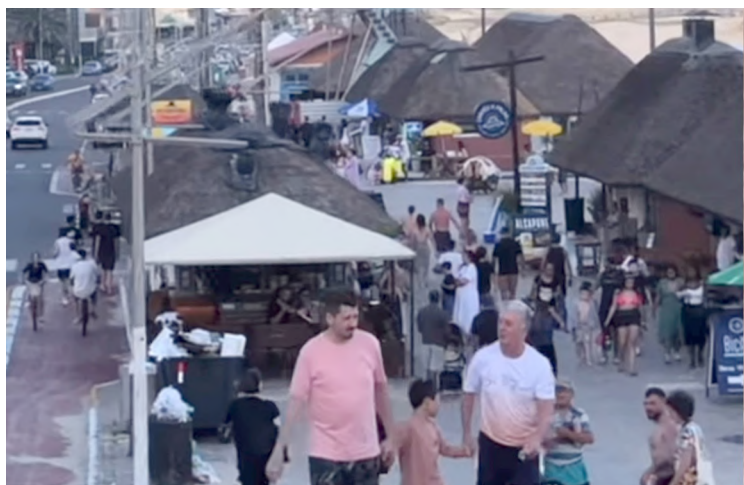
Feriadão teve cidade cheia

Sobre os banheiros mais bem equipados, em estilo container, não há confirmação se estarão disponíveis para a alta temporada.