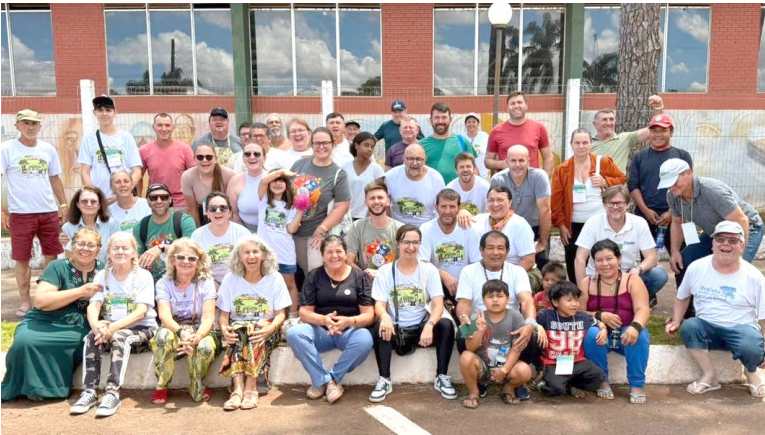
região de Tubarão, em Santa Catarina. A proposta da Rede Ecovida é a promoção da agroecologia. Em seus núcleos regionais, cerca de 2.300 famílias agricultoras se organizam em grupos e associações para produzir e comercializar alimentos saudáveis e sustentáveis.

para facilitar a colheita e o processamento permitiu que uma agroindústria processasse 30 toneladas da fruta em 2024. Essa redução da penosidade do trabalho, com equipamentos adaptados à agricultura familiar, figurou entre os temas abordados nos seminários. Outros conhecimentos compartilhados incluíram o SPDH (sistema de plantio direto de hortaliças), sementes, bioinsumos e mudas de hortaliças. Bienal O próximo Encontro Ampliado será organizado pelo Núcleo Serra Mar em 2027. O município sede deste núcleo é Treze de Maio, localizado na micror-