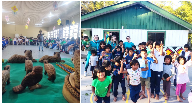
cia Pê na Terra (@vivenciapenaterra) dentro da Escola Indígena Nhu Porã. O

O projeto também está atuando com oficinas de dança, música e atividades lúdicas com o projeto Vivên-