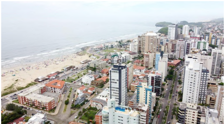
Vista Aérea de Torres

terior à pandemia de Covid-19, o pesquisador acredita não ser visível um impacto direto entre os fenômenos. Principalmente, considerando que a tendência de atração de residentes na região já era visível nos anos 2000, ao comparar o Censo de 2000 com o de 2010. "Os dados de 2022 mostram que não houve grande mudança provocada pela pandemia, já que o período analisado cobre 10 anos antes e apenas dois anos depois de 2020 (quando iniciou a pandemia no Brasil). O município que mais cresceu proporcionalmente foi Imbé, com alta de 51,8% em 12 anos, com um ritmo semelhan-