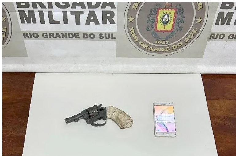
Arma do criminoso, que acabou morrendo na ação policial

Um revólver com numeração raspada foi apreendido. A área foi isolada para o trabalho do Instituto-Geral de Perícias (IGP), que fez o levantamento dos vestígios. O caso é investigado na Polícia Civil. (FONTE – Correio do Povo)