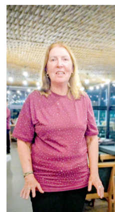
Encerrando sua temporada de veraneio, a super campeã de tênis Andréa Bopp Meister