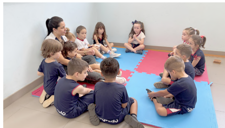
Fé, conhecimento e valores humanos caminham juntos na construção de uma Educação que passa pelo coração