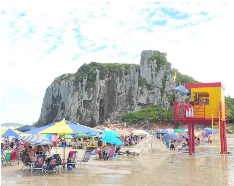
Guarita 11, na Praia da Guarita, em Torres, concentra o maior número de salvamentos no verão

Com Guilherme Sperafico (Correio do Povo)