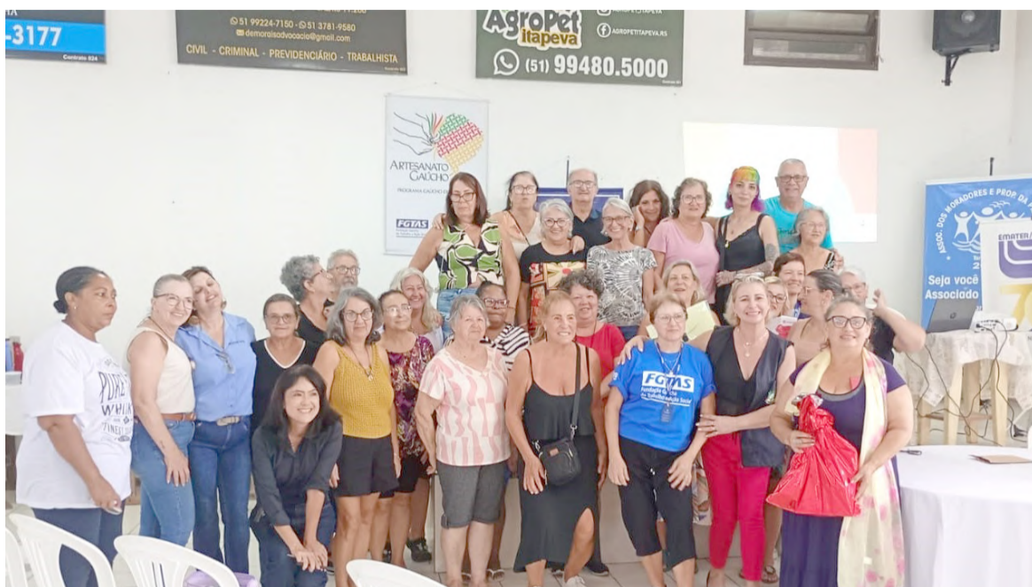
Na foto, o grupo de Artesãs, agora com a habilitação para comercializarem suas criações de maneira legal

Integrando o projeto das “Mulheres da Itapeva”, o evento contou ainda com palestras sobre empreendedorismo e Saúde Bucal através de parcerias com outras entidades de Torres e do Estado, como Emater, Sindicato Rural da Região de Torres, banco Sicredi e Clínica Odontológica NS, aumentando a motivação e o atendimento aos movimentos das mulheres empreendedoras no mês da Mulher.