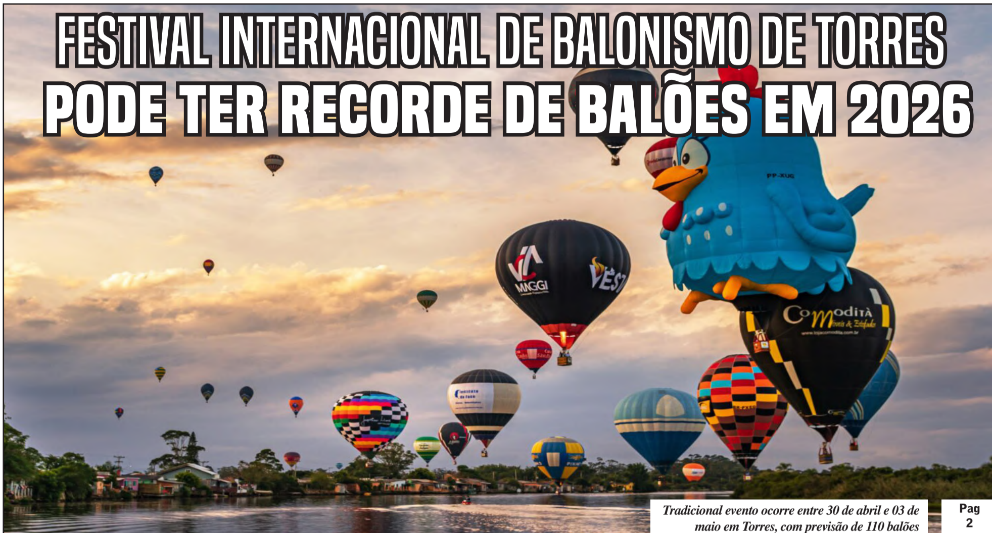
Tradicional evento ocorre entre 30 de abril e 03 de maio em Torres, com previsão de 110 balões