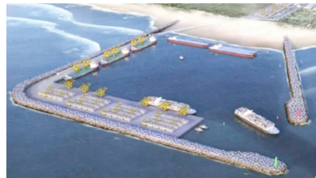
Projeto do novo porto deverá ser construído às margens da Avenida Interpraia Norte, na praia de Rondinha

Para que a audiência ocorra, o Ibama precisa dar o "aceite" final nos estudos de impacto ambiental apresentados pe-