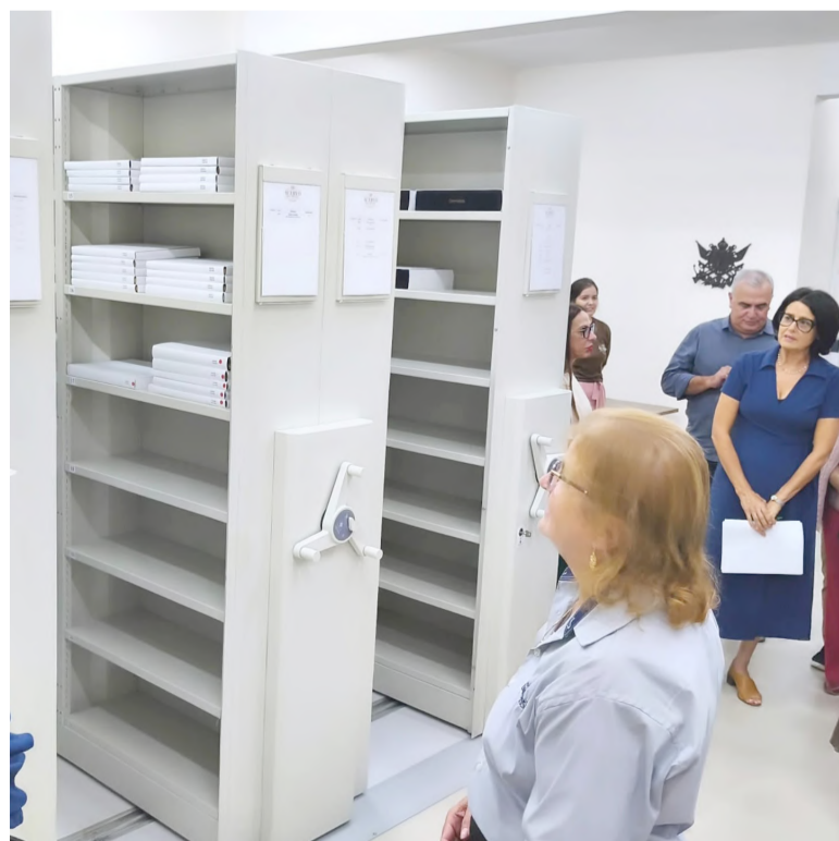
Acervo da Diocese de Osório preserva documentos raros e amplia acesso digital à história regional

O projeto é uma realização da Diocese de Osório através do financiamento do Sistema Pró-Cultura, LIC/RS, com elaboração e gestão da Lahtu Sensu Administração Cultural e patrocínio das empresas Frigorífico Borrússia, Água Mineral Santo Anjo, Madesa, Supermercados Dalpiaz, Arrozagro, Expresso São José, Pabovi, Freepet, Realengo, Frigodal e DaColônia.