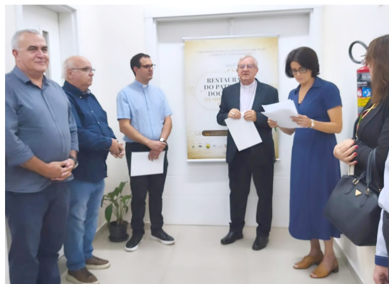
Diocese de Osório inaugura acervo histórico e amplia acesso à memória do Litoral Norte gaúcho

volumes manuscritos e revelou, no dia da inauguração, a existência de um registro ainda mais antigo do que o inicialmente divulgado: um livro da Paróquia de Santo Antônio da Patrulha, datado de 1761, período em que a Igreja Católica era responsável pelos registros oficiais da população. Com livros de batismos, matrimônios e óbitos que atravessam séculos, o conjunto preserva não apenas dados, mas trajetórias familiares, a formação das comunidades e a própria estrutura social da região.