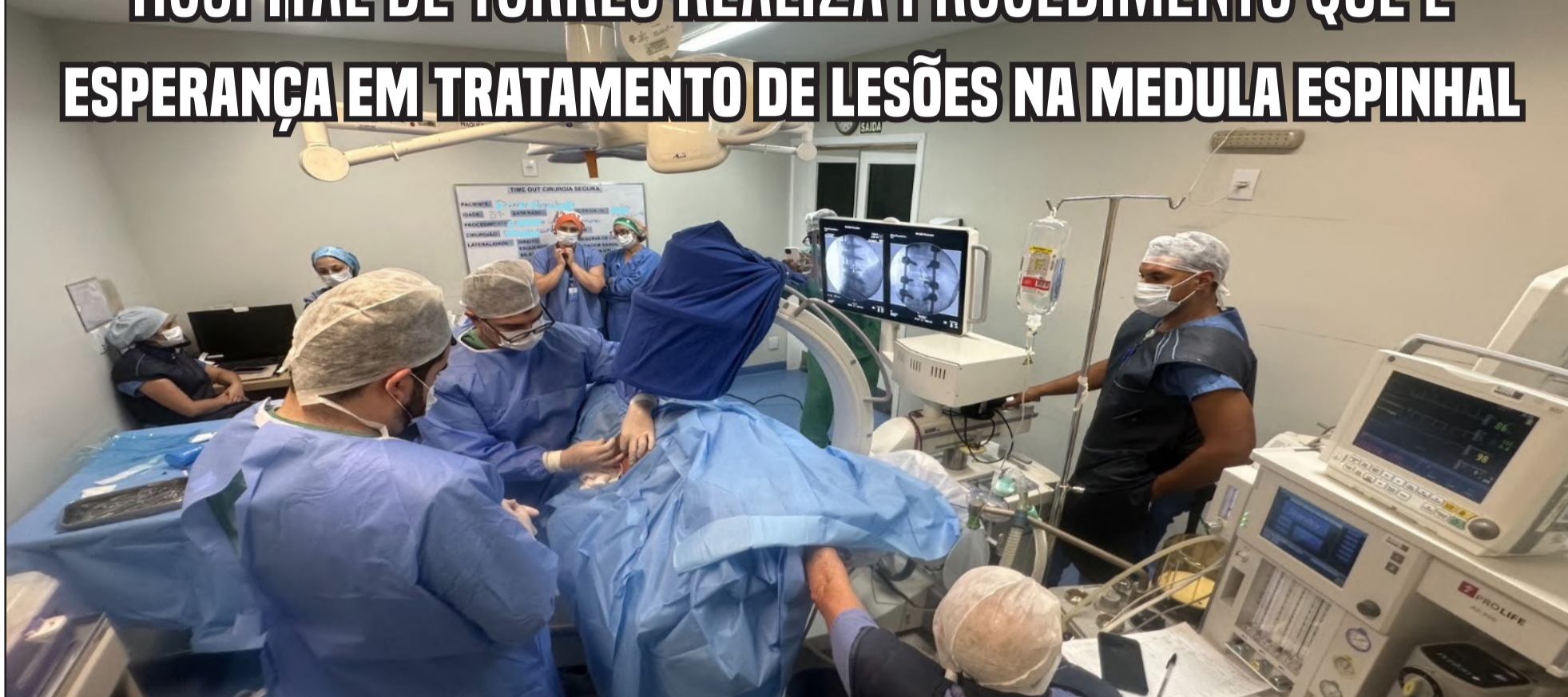
Procedimento marcou a aplicação intramedular experimental de "polilaminina" em um paciente com histórico de lesão medular, tornando-se o segundo paciente com o procedimento realizado no RS