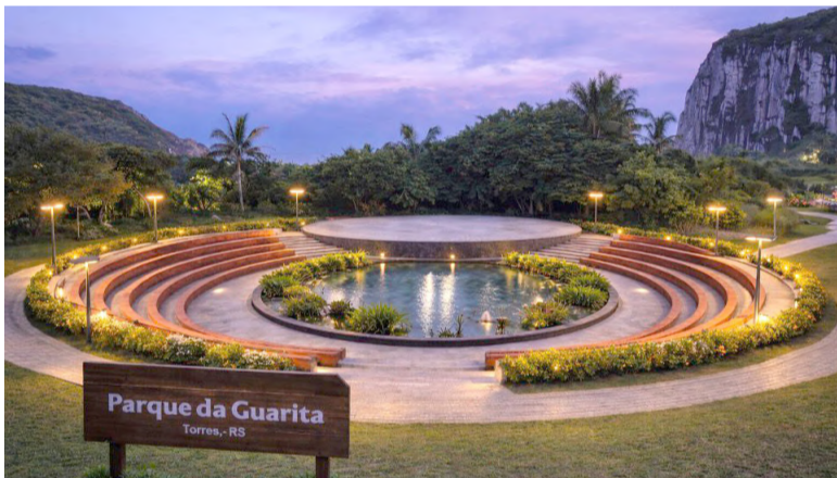
Junto ao texto da indicação, consta esta imagem, sugerindo o novo layout do anfiteatro