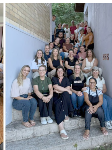
atividade foi ao encontro do que as professoras acreditam, mas que por vários motivos às vezes vai ficando esquecido.