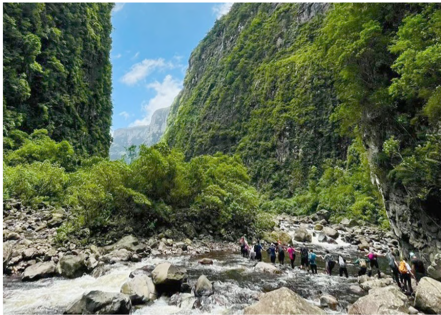
Trilha do Rio do Boi, em Praia Grande (SC) é considerada Trilha de Longo Curso (foto)

As palestras, oficinas e mesas-redondas vão debater temas