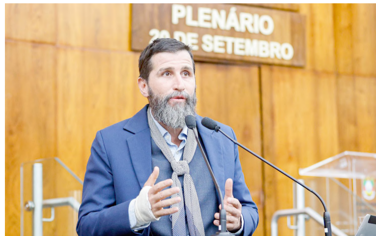
Gaúcho da Geral foi autor do projeto

As atividades poderão ser ministradas por profissionais da segurança pública ou por instrutores qualificados em artes marciais e defesa pessoal, desde que comprovem formação técnica. O projeto também autoriza o Poder Executivo (Governo do RS) a firmar parcerias com entidades públicas