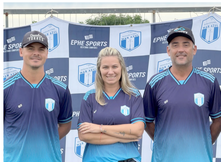
valores como disciplina, respeito e trabalho em equipe.

Com sede no bairro Getúlio Vargas, o Mar Azul mantém uma estrutura voltada à formação esportiva, com escola de futebol para crianças a partir dos 5 anos, promovendo não apenas o desenvolvimento técnico, mas também