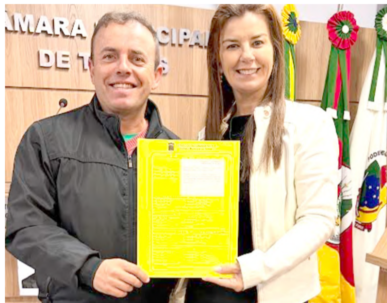
violência doméstica e construir uma sociedade baseada no respeito. (Por Maiara Raupp – Assessoria Gabinete Ver. Carla Daitx)

Para os parlamentares, investir na conscientização masculina é também investir na segurança das mulheres e das famílias de Torres, fortalecendo uma abordagem humanizada e eficaz para romper o ciclo geracional da