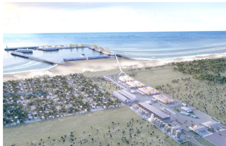
Maquete eletrônica esboça projeto do Porto Meridional em Arroio do Sal

Além disso, o Instituto Brasileiro do Meio Ambiente e dos Recursos