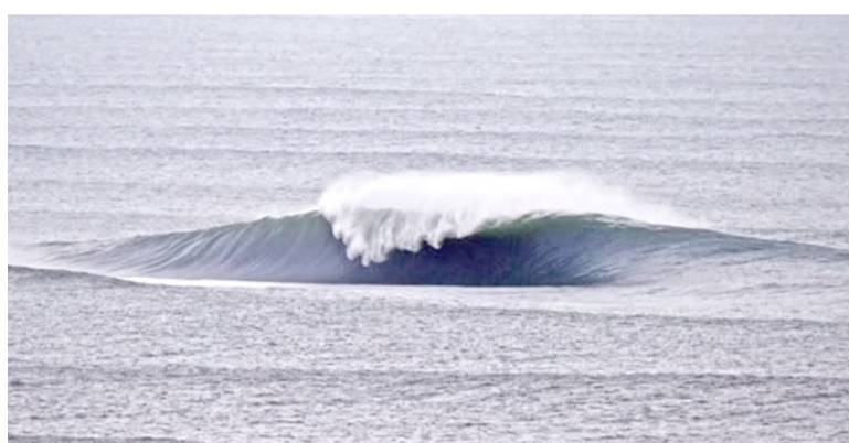
Onda perfeita, quebrando solitária na Ilha dos Lobos

questões ambientais (com importante participação no processo da Associação dos Surfistas de Torres - AST). E mais expectativa vem sendo gerada desde que foi aprovado o Plano de Uso Público da REVIS Ilha dos Lobos, documento fundamental para o planejamento e definição de estratégias de visitação à ilha de forma ordenada, com uma dinâmica que não cause interferências inaceitáveis na biodiversidade local deste 'tesouro' de Torres. (FONTES - Dapraia News/Revis Ilha dos Lobos)