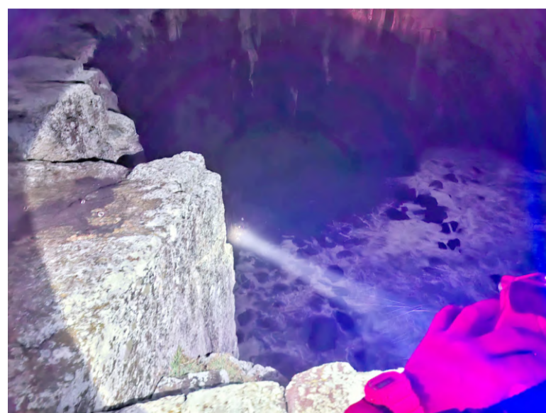
Nesta semana, corpo de bombeiros teve de atender ocorrência registrada como suicídio no Morro das Furnas