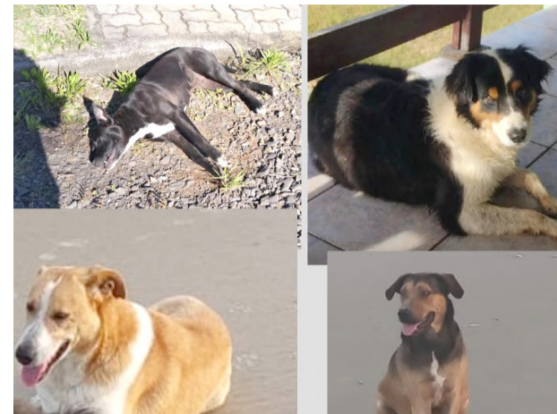
Animais vitimados, que conforme testemunha morreram em agonia

Foi registrado um boletim de ocorrência na Delegacia de Polícia (sendo o fato registrado como fato consumado de maus-tratos aos animais), e há testemunhas sobre a condição de sofrimento dos cães. Mas até o fechamento desta matéria, ainda não se sabe ainda quem fez isso.