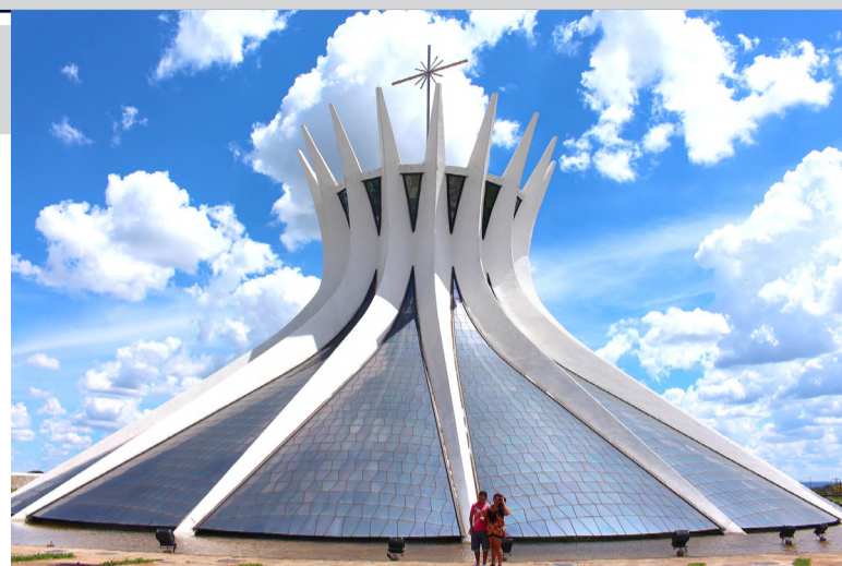
Catedral Metropolitana de Brasília

Penso que está estabelecido o caos na relação entre o poder público e a sociedade. Parece que existem dois mundos: O REAL e o mundo da narrativa do sistema político-administrativo brasileiro. Resta 'rezar' para que os quase R$ 5 bilhões que estão sendo 'dados A MAIS' para que esse mundo (via fundo eleitoral) realize um certame, para ver quem vai pegar as "boquinhas" do poder no Brasil, consiga eleger pessoas que tenham