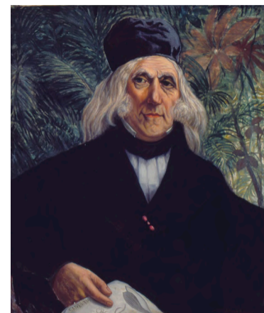
Título: RETRATO DE AUGUSTO DE SAINT HILAIRE (Autor: MANZO, HENRIQUE/ em Museu Paulista da USP)

A obra de Auguste de Saint-Hilaire é um espelho desconfortável das contradições do Brasil Imperial. Ela flutua entre o brilho do rigor científico e a sombra da brutalidade social. Seus diários são fundamentais não apenas pelo que descrevem sobre a fauna e a flora, mas pelo que revelam sobre a construção deliberada da exclusão e da exploração no Rio Grande do Sul. Ao revisitarmos esses 206 anos de história, somos forçados a encarar os silenciamentos da narrativa oficial. Afir-