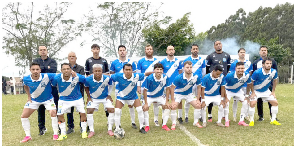
Equipe do São Brás

No campo do C.E.I, ADESCOM e Igra não saíram do empate por 0 a 0 na abertura da chave.