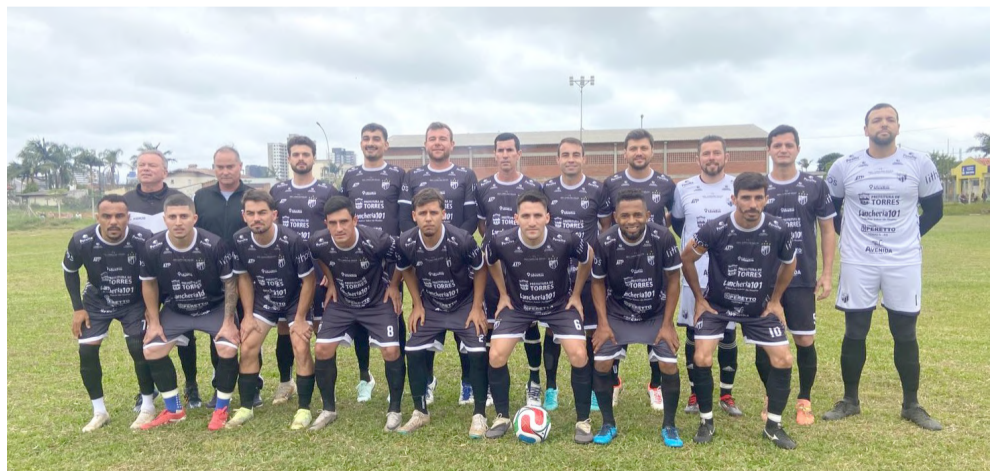
Equipe do São João

Além dos jogos da 1ª divisão, neste domingo (07) a 2ª Divisão torrense dava seus primeiros passos na temporada